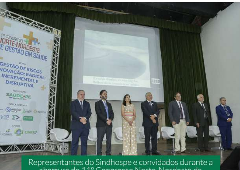
Representantes do Sindhospe e convidados durante a abertura do 11º Congresso Norte-Nordeste de Gestão em Saúde