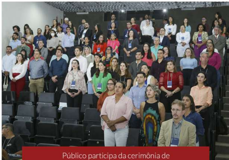
Público participa da cerimônia de abertura do Congresso