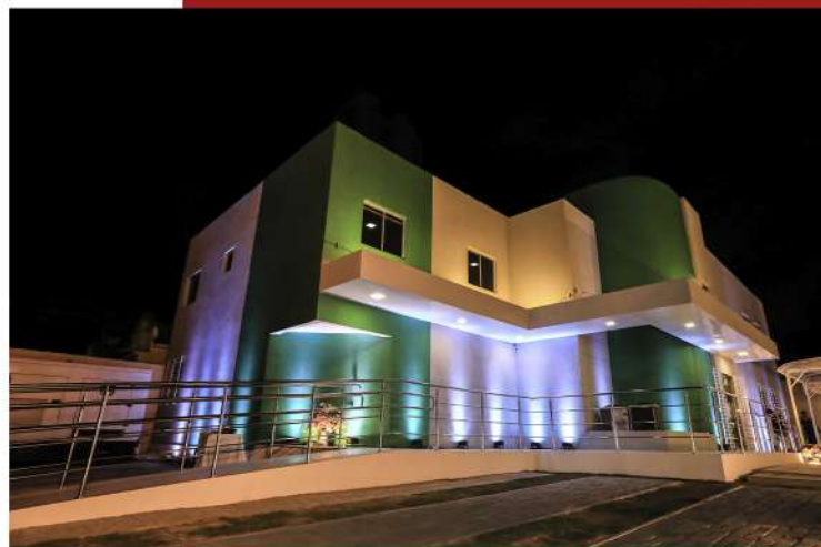
Sede do Sindhospe fica localizada no bairro de Santo Amaro, área central do Recife

Para o ano de 2023, o Sindhospe se prepara para promover mais encontros com a sociedade, se aproximar ainda mais dos associados, na capital e no interior, e se manter como voz importante nas questões referentes à saúde em todo o estado de Pernambuco. Representante patronal, o Sindhospe é a união de importantes setores da saúde privada do estado dispostos a continuar entregando um serviço de excelência, que é orgulho para todos os pernambucanos.