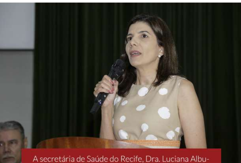
A secretária de Saúde do Recife, Dra. Luciana Albuquerque, discursa durante o evento