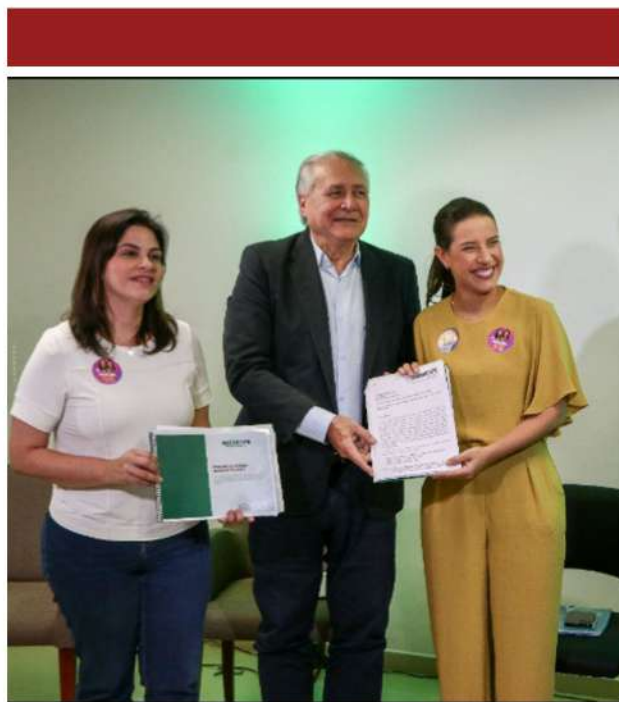
Presidente do Sindhospe entrega documento à governadora eleita, Raquel Lyra (dir) e à vice-governadora eleita, Priscila Krause (esq)

Entre os projetos apresentados pelo Sindhospe à próxima governadora, estão: