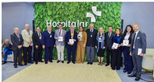
Sindhospe presente no maior evento médico-hospitalar do Brasil

Reunião entre Sindhospe, CNSaúde e Fenaess com associados para debater Lei do Piso da Enfermagem.