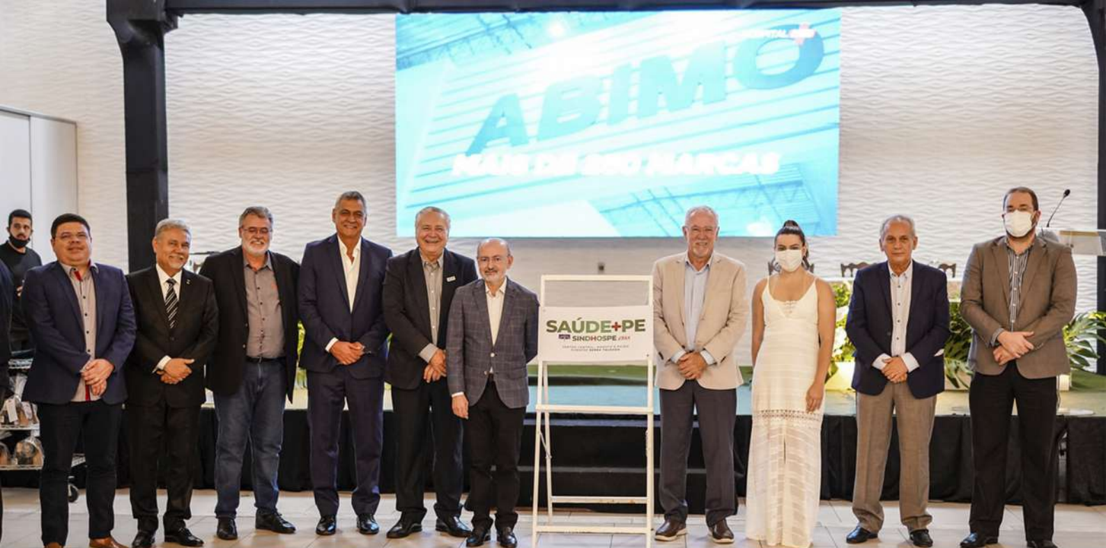
Diretoria e Associados do Sindhospe prestigiam inauguração da subsede de Serra Talhada